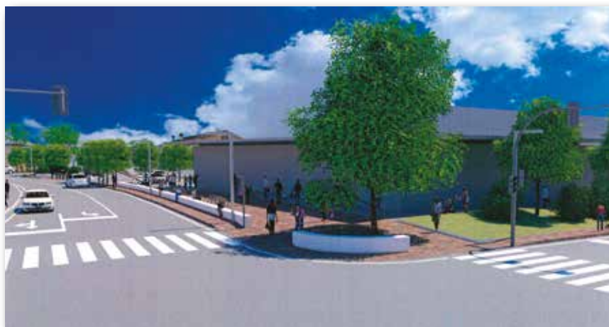
Il rendering della nuova Coop in direzione di via Gen. Maglietta

Da un punto di vista urbanistico si tratta di uno dei punti più importanti del paese, in quanto ingresso principale per tutti coloro che giungono da Vicenza, che raggiungono l'Altopiano, nonché per le persone che transitano nell'asse Bassano-Schio. Come Amministrazione, sin dall'inizio della nostro mandato, abbiamo evidenziato alla proprietà la nostra intenzione di procedere ad uno sviluppo urbanistico complessivo dell'area in armonia con il territorio. La Coop, già proprietaria dell'immobile prima del 2014, ha quindi raccolto la sfida di recuperare il complesso edilizio esistente,