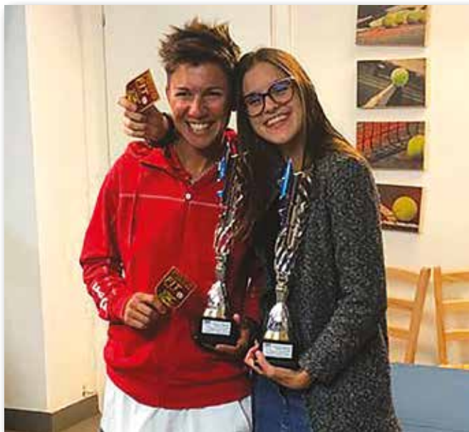
Le neo campionesse regionali di doppio