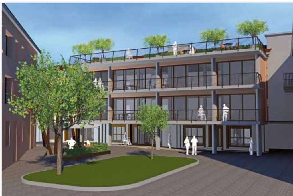
Il nuovo ingresso coperto con gli ampliamenti e le terrazze ai piani primo e secondo

Per l'impatto sul territorio, per il tipo di servizio che si offre e per le professionalità che abbiamo incontrato, noi sentiamo il bisogno ed il dovere di operare per il bene di tutti.