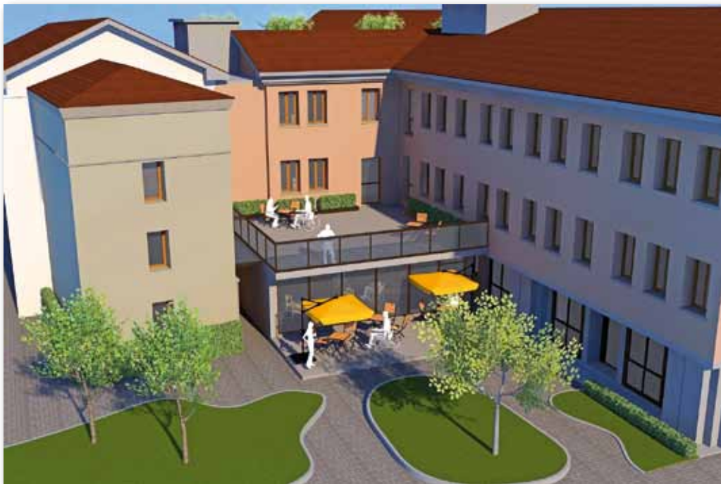
L'ampliamento del piano terra per la nuova hall con zona bar

La casa di riposo, intesa come residenza assistita, oggi è limitata a ventiquattro posti, anche se nei nostri progetti c'è l'intenzione di dare una risposta maggiore alla residenzialità protetta per gli anziani autosufficienti.