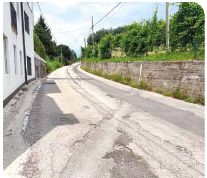
In corso di realizzazione Via Costa euro 56.000,00

"Il valore di un'idea sta nel metterla in pratica."