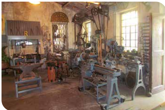
A cura del Gruppo Ricerca Storica