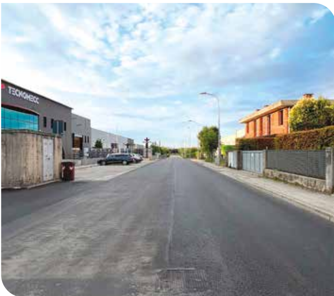
Completamento dell'asfaltatura di Via dell'Artigianato euro 74.000,00