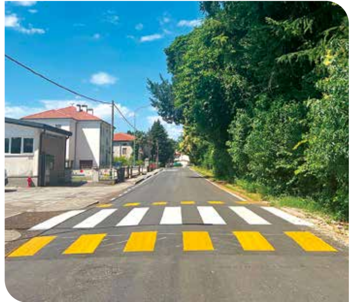
Asfaltatura di Via San Valentino e realizzazione del dosso euro 60.000,00