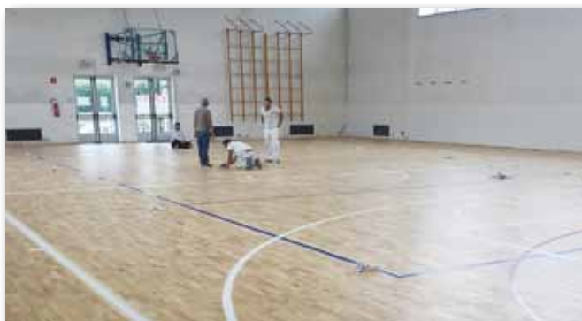
Ultimati in settembre il rifacimento della pavimentazione della palestra della scuola media e la sistemazione delle attrezzature per la pallacanestro. Investimento: € 50.0000.