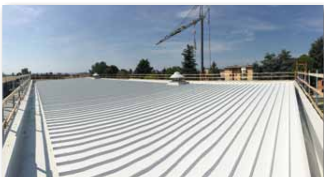
Ultimato in agosto l'integrale rifacimento del tetto della palestra della scuola media. Investimento: € 115.000.