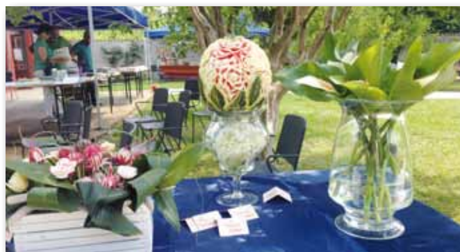
Splendide decorazioni di Terenzio de "La Cusineta"