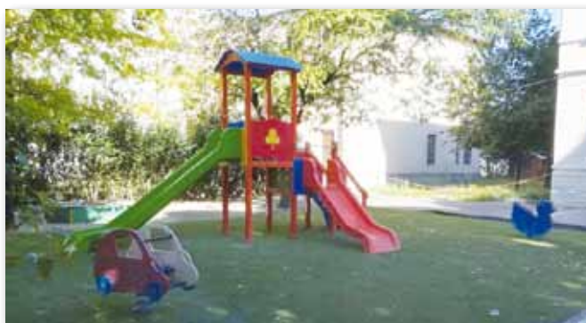
Ultimata la sistemazione dell'area gioco della Scuola dell'Infanzia di Maragnole. Investimento: € 11.900.