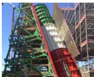
Viadotto Zambra - Italia