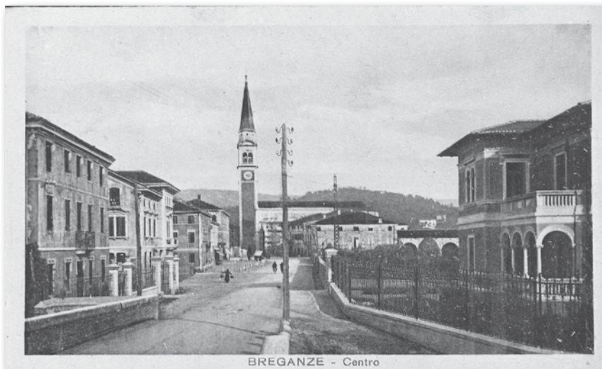
Cartolina del 1933 con una vista da sud del centro di Breganze. (Edizioni Lelio Leoni, Foto Antonio Marchesan)

Il Gruppo di Ricerca di Breganze ha deciso di impegnarsi in una raccolta di cartoline illustrate che per oltre un secolo hanno raccontato Breganze e i breganzesi. Un lavoro che si pone come obiettivo di allestire per il prossimo novembre, in biblioteca, una mostra tematica e di curare, per il 2018, una edizione speciale dei "Quaderni Breganzesi" dedicata al tema. Questo coinvolgendo appassionati, collezionisti ma anche la comunità attraverso la promozione di una raccolta di cartoline storiche. La pubblicazione sarà l'occasione per descrivere i luoghi, gli eventi e le persone a cui le cartoline si riferiscono; attraverso note storiche, aneddoti e curiosità tecniche. Chi fosse interessato ad approfondire questa iniziativa e a partecipare al gruppo di lavoro può inviare una mail al grs_breganze@libero.it , segnalare il suo nominativo in biblioteca o contattare direttamente il Gruppo. Le cartoline raccolte