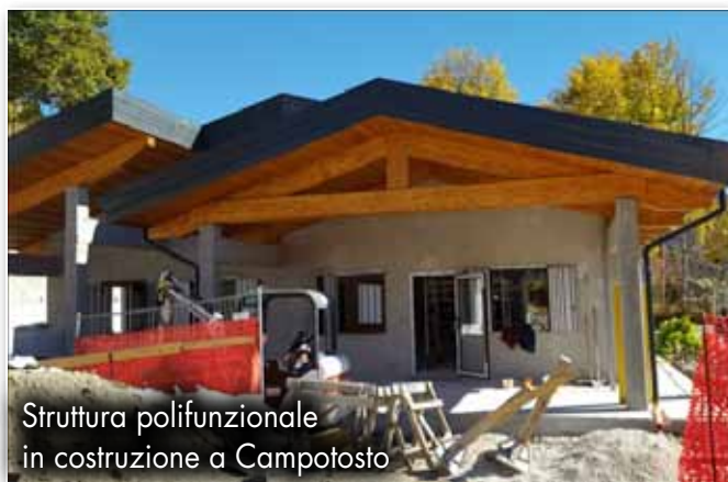
Struttura polifunzionale in costruzione a Campotosto