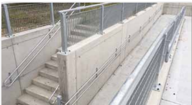
Ultimata in luglio una rampa di accesso ad una sala posta nel piano seminterrato della scuola media, con ristrutturazione della sala stessa che verrà adibita a laboratorio scolastico. Investimento: € 50.000.