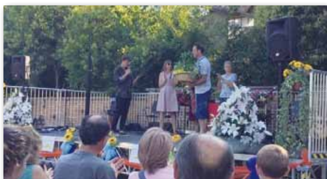
Un momento della premiazione