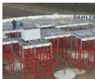
Centrale Biogas Grimsby - Canada