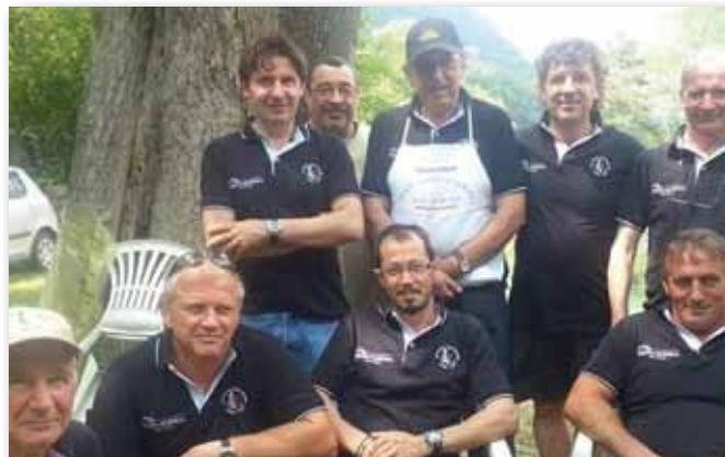
Il consiglio direttivo di "Ciaon Vivo"

è stato aggiunto per sottolineare l'impegno a salvaguardare i corsi d'acqua e la fauna ittica che li abita. In sintesi le attività sociali di "Ciaon Vivo": - Controllo ed eventuali segnalazioni dello stato dei corsi d'acqua; - Immissioni e recupero della fauna ittica; - Uscite di pesca in mare per la pesca degli sgombri; - Uscite di pesca nei laghetti