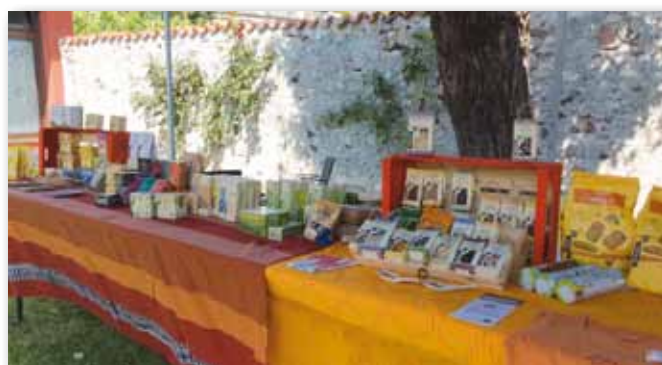
Mostra-mercato di libri a tema floreale e non solo