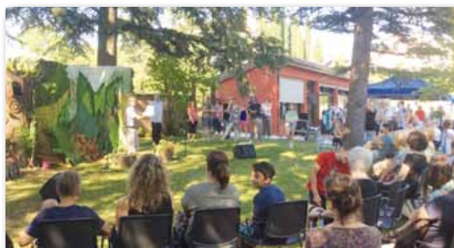
Spettacoli teatrali e risate con Claudio Cappozzo