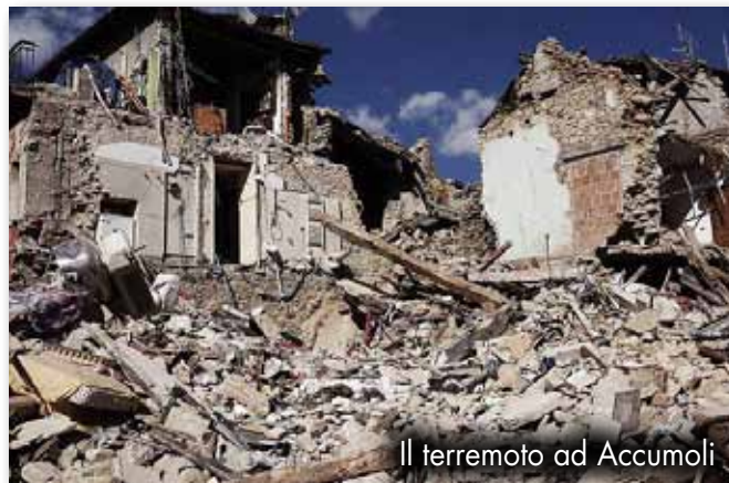
Il terremoto ad Accumoli

Portico: 64 mq Locali per il pernottamento 200 mq